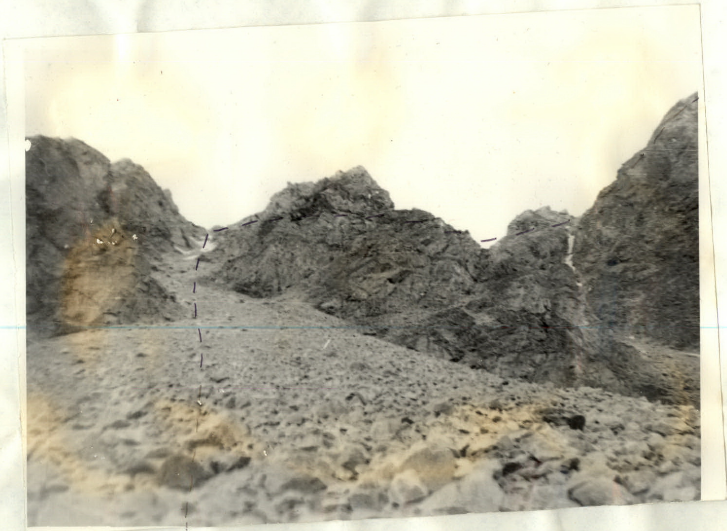
--- СПУСК С ВЕРШИНЫ.